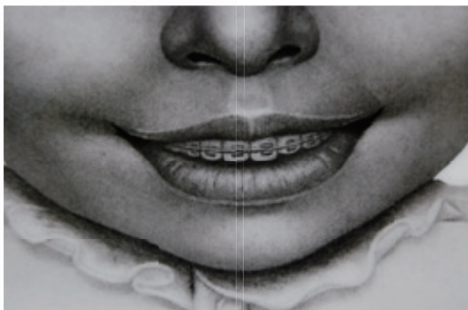
Naritaka Satoh, 笑み Grin, pencil/acrylic/charcoal on paper/panel, 65, 2x53cm, 2009 Detail