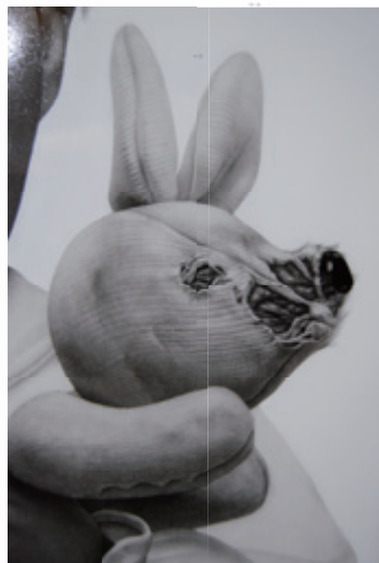
Naritaka Satoh, 飼育 Domestication, pencil/acrylic/charcoal on paper/panel, 162x97cm, 2009 Detail

4. Next, we should stress the significance of "the choice of one's direction". The choice was, of course, existential and conceptual, but at the same time simply educational. In fact, there are plenty of young artists in Japan who have a high level of drawing technique. More than that, it is well known that scrupulosity, precision and the "talent to copy" are some of the general features not only of Japanese art, but the culture in general. Young Japanese artists who present naturalistic painting sooner or later understand that "representational precision" is not enough. They are usually told that their works lack "content". In search of this "content", they rush into fiction, for example referring to mythological motives or painting pop characters and so on. The point is that Satoh and Mohri could find the value ("content") of their art without leaving the field of realistic depiction and existing objects and at the same time overcome simple Realism. If we define (for a moment) "fiction" as something that doesn't belong to reality, then we can say that works of Satoh and Mohri are "naturalistic paintings with the powers of fiction". In other words, Satoh and Mohri went to the opposite direction in relationship to those artists who switched to "plain mythology", and thus raised deeper issues of representation of both reality and the inexplicit. This is what makes them a case model and makes them deserve broader attention.